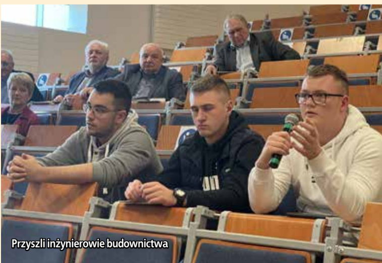
Przyszli inżynierowie budownictwa