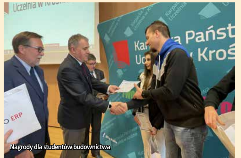
Nagrody dla studentów budownictwa

Następne wystąpienie dotyczyło Branżowego Bilansu Kapitału Ludzkiego (tzw. BBKL) dla branży budowlanej. Prezentację celów badania oraz najważniejszych wyników